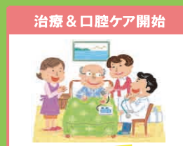
治療&口腔ケア開始